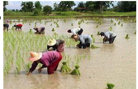
ご近所みんなで助け合いの田植え (昭和35年ごろ)