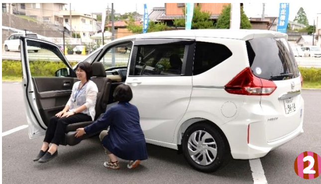
▲車種「フリード」 助手席が外まで降りて乗り降りしやすいタイプです。

市内在住の障がい者、高齢者、歩行が困難で車椅子を利用されている方。利用期間は、原則3日以内です。費用は無料ですが、使用燃料のみ負担していただきます。希望する日の3か月前から1週間前までに申請が必要です。何れも利用前にお電話で空き状況等をご確認ください。