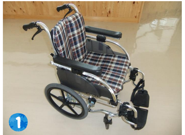
▲介助用と自走用の2タイプがあります。