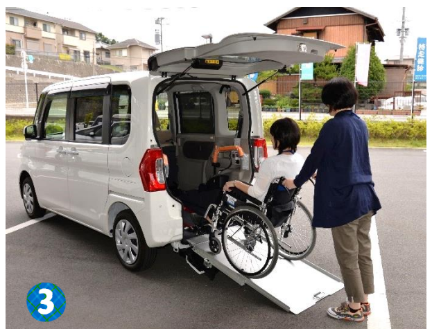
▲車種「タント」 車椅子ごと乗れるタイプです。